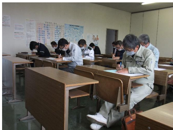
運転適性検査（中越）