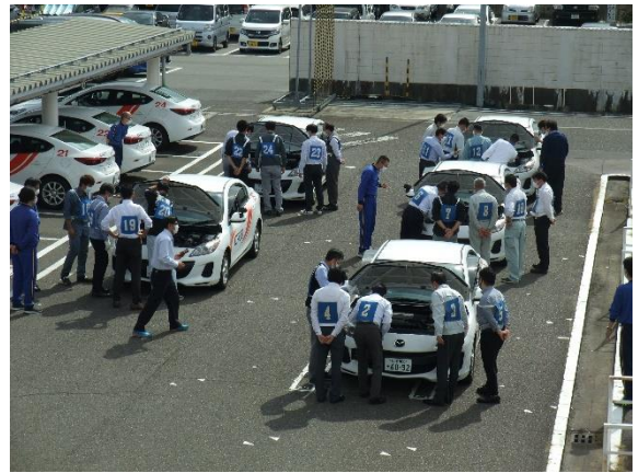
車両点検研修（下越）