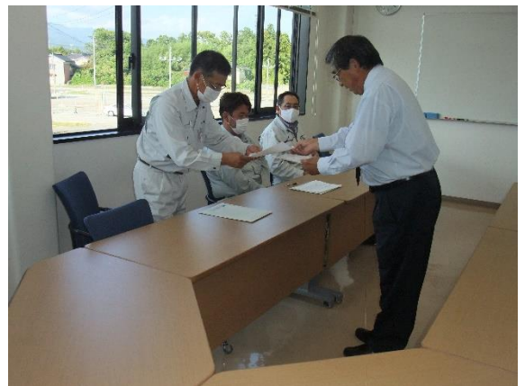
修了証書授与（佐渡）