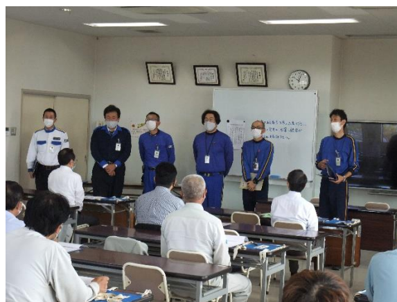
研修内容の説明及び指導員の紹介（下越）