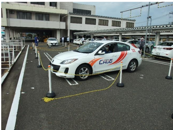
ブルッカレコード：タコつぼ運転研修（下越）