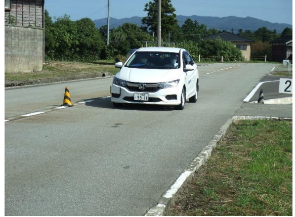
急制動運転研修（佐渡）