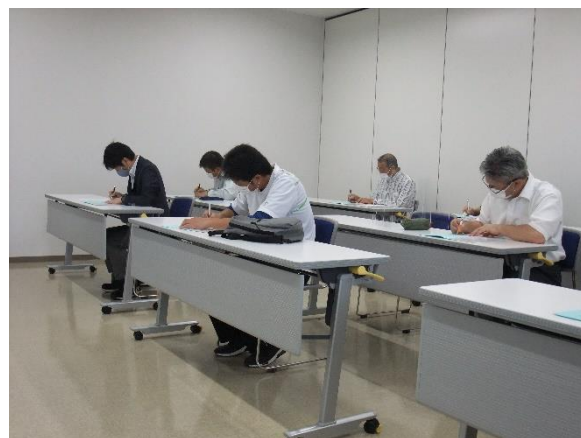
運転適性検査（上越）