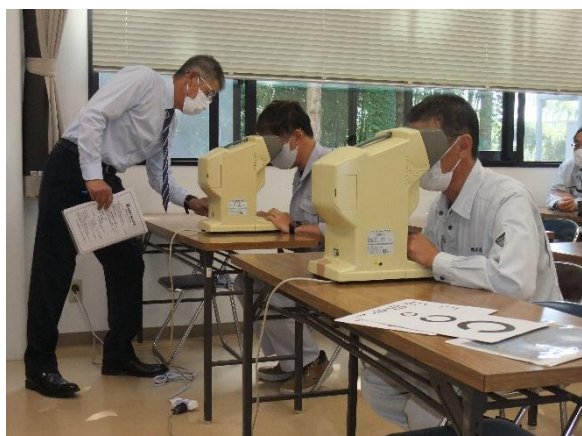
動体視力検査（佐渡）