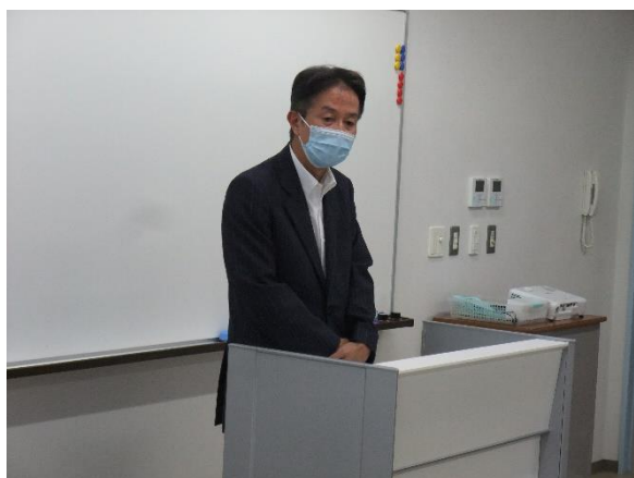
地区協会長あいさつ（上越）