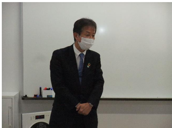
地区協会長あいさつ（上越）