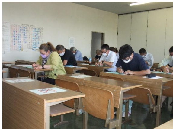
運転適性検査（中越）