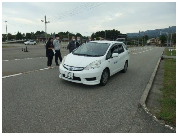
ペダル踏み間違い時 加速抑制装置体験（佐渡）