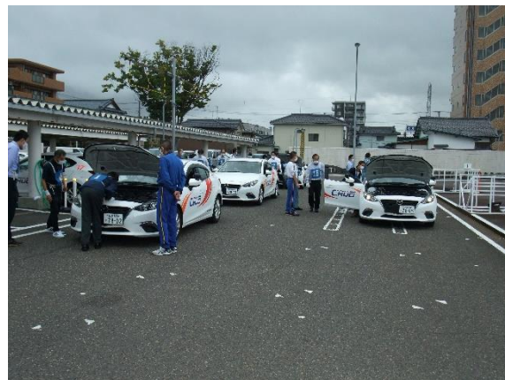
車両点検研修（下越）