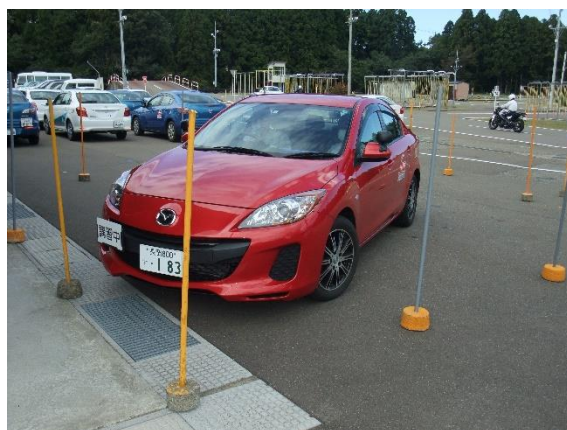
ブルッカレコード：タコつぼ運転研修（上越）