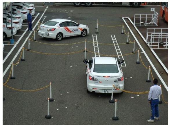
ブルッカレコード：タコつぼ運転研修（下越）