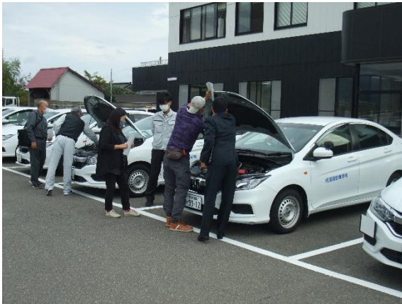
車両点検研修（佐渡）