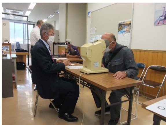
動体視力等検査（佐渡）