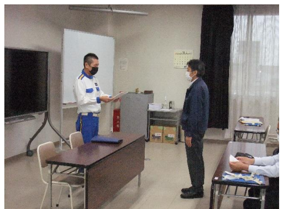
修了証書授与（下越）