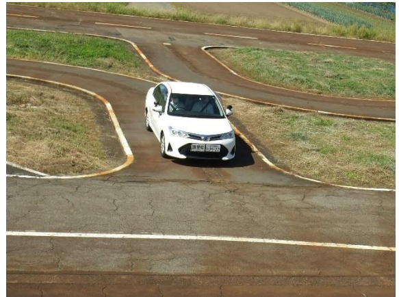
コース運転研修（中越）